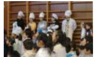
マラガイ校の先生は みんなコックさん