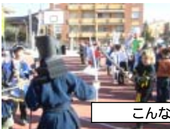
こんな交流シーンも