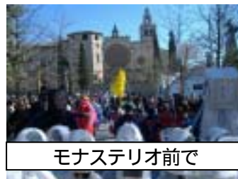
モナステリオ前で

サン・クガット市マラガイ校周辺で行われたカルナバルに、多数の保護者の方々が児童の様子をご覧に来てくださり、ありがとうございました。また、2月23日(金)の授業参観、学年懇談会、保護者会総会等にも多数ご出席いただきありがとうございました。昨年4月から約1年間が過ぎ、お子様の成長ぶりを感じ取っていただくことができましたでしょうか。また、学年懇談会等でお出されましたご意見等も念頭に置きながら、平成19年度に向けて様々な準備を進めて参りたいと思います。保護者会役員の皆様には、13日の「卒業進級を祝う会」でもたいへんお世話になります。よろしくお願ひ申し上げます。