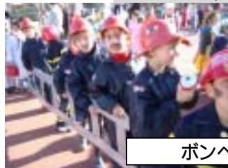
ボンペロス vs 火消し