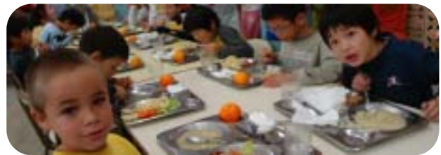
イシドロ校訪問交流(小1~3)