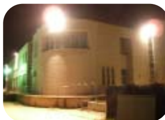
感知式警備用照明灯