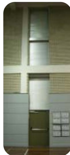
体育館窓防犯シャッター