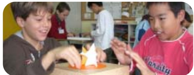
マラガイ校来校交流(小4~6)